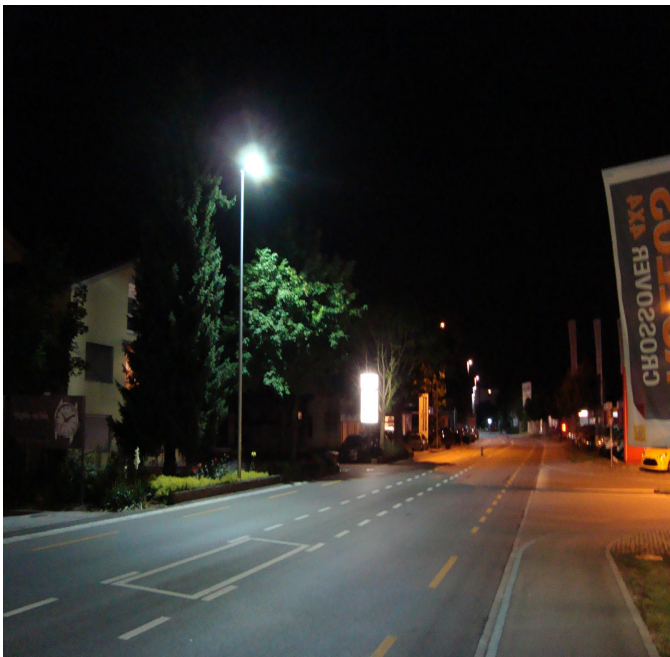
USL4, 112W, installiert an einer Hauptstrasse in Bern