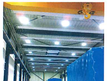
LED Beleuchtung in Halle mit einer Lichtpunkthöhe von 9,3m

UNITRON ist seit 1985 in der Entwicklung und Produktion von LED Produkten tätig und bietet für den Aussen- wie Inneneinsatz die ideale Lösung im Bereich der Energie sparenden LED Beleuchtung für Büros, Shops, Läden aller Art, Ausstellungen, Lager, Tiefkühlräume, Produktionsräume, Schulen, Unis, Tankstellen, Restaurants, Strassen, Parkplätze, Tunneln, Sportplätze, Turnhallen, kurz, für überall dort, wo die herkömmliche Energie „fressende“ Beleuchtung wie Glühbirnen, Scheinwerfer, Flutlichtstrahler, Strassen- und Tunnelleuchten, Sparlampen, FL Röhren etc. ersetzt werden sollen. Unsere Referenzen finden Sie im In- und Ausland von 1-Mannbetrieben bis zu Grossbanken, Kernkraftwerken, Ölgesellschaften und viele weitere sehr zufriedene Kunden in allen Klimazonen.