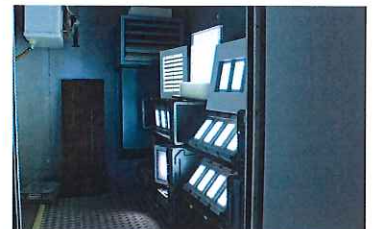
LED Leuchten im Klimatest -25°C - +65°C in 2-Stunden-Zyklen bei UNITRON