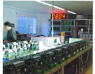
Teilansicht der Produktion bei UNITRON